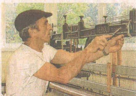
Traditionelles Handwerk wird hier gepflegt, spiegelt sich in den hochwertigen Produkten wider und wird auch für Besucher erfahr gemacht.