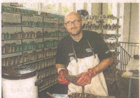
Das Erlebnis der Manufaktur vom Rohmaterial bis zum fertigen Produkt ist eine wichtige Erfahrung auf dem Weg in den ersten Arbeitsmarkt.