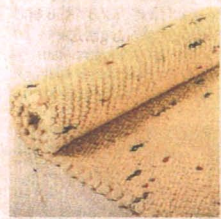
Teppiche nach Maß