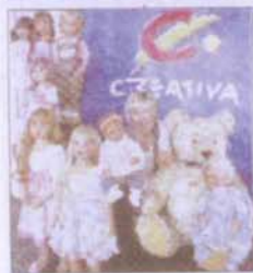
Creativa in Dortmund vom 13. bis 17. März, täglich von 9 bis 18 Uhr Europas größte Messe für

Kreatives Gestalten wird am kommenden Mittwoch in den Westfalenhallen eröffnet. Mehr als 700 Aussteller werden ihre Ideen und Produkte in den Hallen 3 B bis 8, im Messe-Forum und im Außengelände präsentieren. Erstmals findet am Samstag und Sonntag parallel zur Creativa ein Puppen- und Bärenmarkt statt, ein internationaler Salon für Liebhaber, Künstler, Hersteller und Sammler. Eintritt: Erwachsene zahlen 10 Euro, Kinder von 6 bis 13 Jahren 4 Euro. Online-Tickets unter