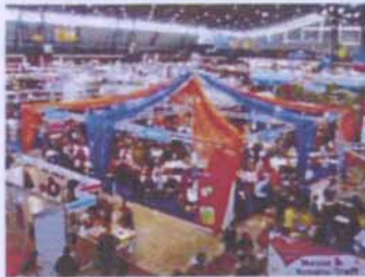
Kunst & Kreativ Bastelzirkus

Bastelzirkus – Manege frei für Kreativ - Jongleure (Dortmund, den 14.02.2013) Der Bastelzirkus ist vom 13. bis 17. März ein Magnet für alle Kreativen auf der Dortmunder CREATIVA. Die beliebtesten Bastel-Trends gibt es zum Ausprobieren. Auf der Bastelzirkus Workshop-Fläche von über 200 m 2 werden in diesem Jahr 20 verschiedene Workshops und Vorführungen aus den Themenbereichen Handarbeiten, Basteln, Papier, Malen angeboten.