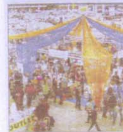
Jeder kann an den Workshops am Stand teilnehmen.

duktneheiten, wie den Foto Transfer Potch ausprobieren. Der Omnibusbetrieb Hinrich Uffen in Oldersum, organisiert am Mittwoch, 13. März, eine Busfahrt zur „Creativa“ nach Dortmund. Wer sich dazu anmelden möchte, kann das an die E-Mail Adresse info@uffen-reisen.de tun.