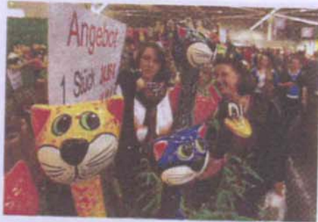
Kreatives aller Art gibt es wieder im Messezentrum der Westfalenhallen zu sehen.

len, Malen und Zeichnen bis zum Töpfern. Neben der reinen Messe mit rund 550 Ausstellern gibt es interaktive Sonderschauen und Kreativ-Workshops, die zum Mitmachen und Gestalten einladen. So finden parallel zur Creativa auch die Themen-Messen „LandGarten.kreativ“ und „PerlenExpo“ sowie (nur Samstag und Sonntag) eine Puppen- und Bärenbörse statt. Westfalenhallen