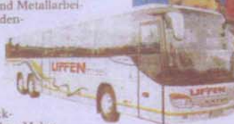
Beim Bastelzirkus von „Kunst & Kreativ“ finden verschiedene Kreativ-Workshops statt.

Schmuck-Herstellen, Malen und Zeichnen bis hin zum Töpfern. Neben der reinen Messe, in welcher rund 550 Aussteller ihre Kreativprodukte präsentieren und erklären, werden den Besuchern zahlreiche interaktive Sonderschauen und Kreativ-Workshops ange-