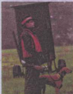
Jäger wollen keine Schutzräume für Wildschweine.

Die Naturschützer hatten sich mehr erhofft. Die neue Fassung des Bundesjagdgesetzes setze die Hür-