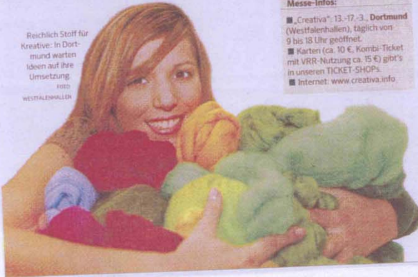
Reichlich Stoff für Kreative: In Dortmund warten Ideen auf ihre Umsetzung.

Zuwachs bekommt die „Creativa“ erstmals durch den Anschluss des Puppen- und Bärenmarkts. Hier warten antike, handgefertigte Puppen, daneben aber auch Barbies aus vielen Epochen. Außerdem gibt es noch die anderen Bereiche der Messe zu entdecken, die das Angebot abrunden: Wer einen grünen Daumen unterm Fingerhut hat, wird bei der „LandGarten kreativ“ Anregungen finden: Fertige funkelnde Kunstobjekte und Werkzeuge zur Herstellung zu Hause gibt es bei der „PerlenExpo“. Das Angebot der Messe macht deutlich: Kreativität kennt keine Grenzen. 20