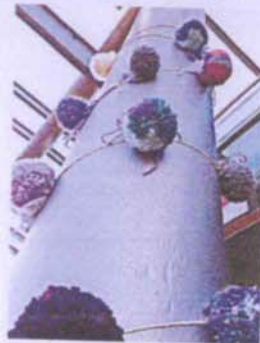
Netto: 19,99 € (inkl. MwSt.) 19,99 € (inkl. MwSt.)